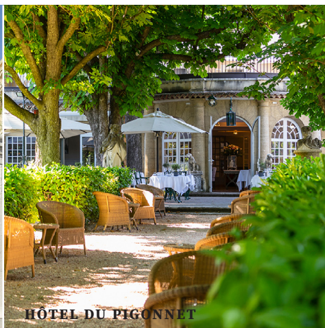
HÔTEL DU PIGNONNET