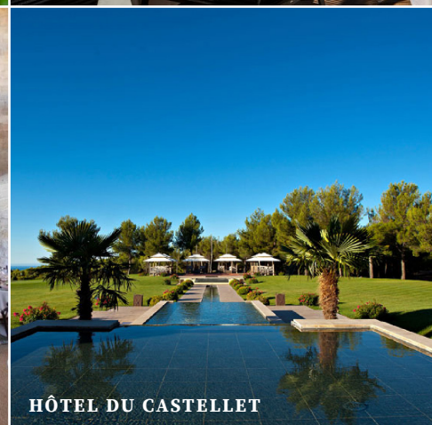
HÔTEL DU CASTELLET