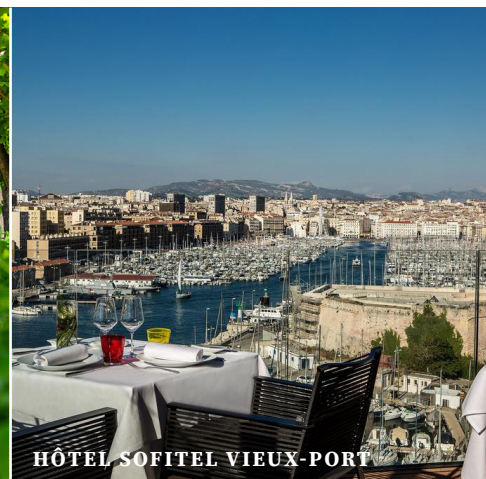
HÔTEL SOFITEL VIEUX-PORT