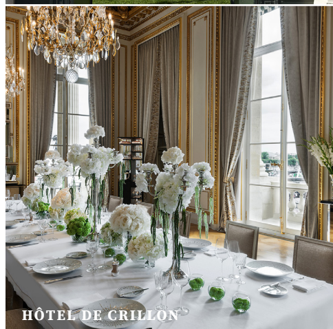
HÔTEL DE CRILLON